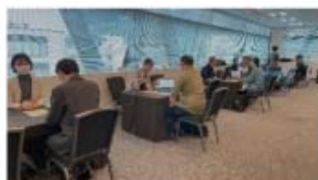
合同企業説明会の様子