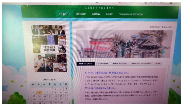
▲ホームページ見直しの作業