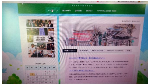
▲ホームページ見直しの作業