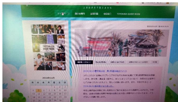
▲ホームページ見直しの作業